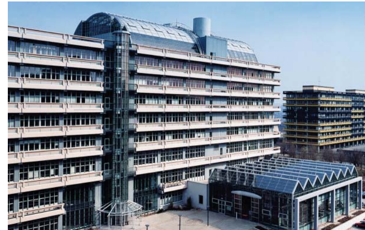
Technologiezentrum Ruhr, Bochum